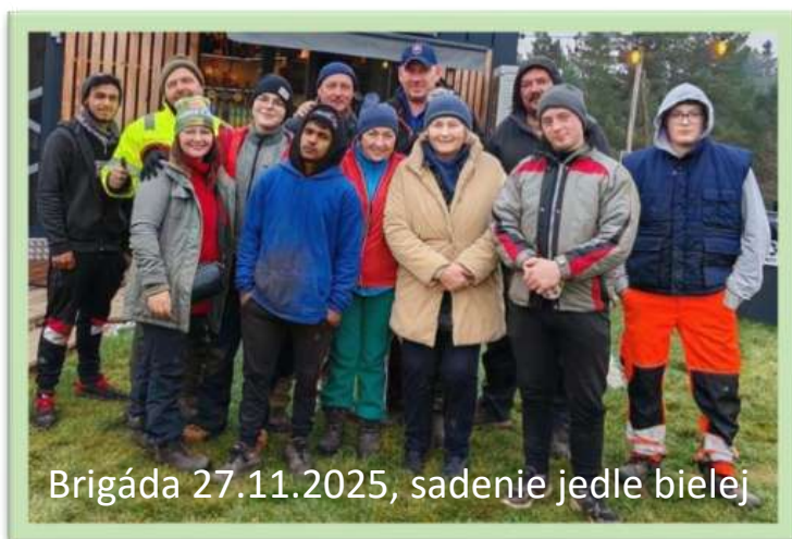
Brigáda 27.11.2025, sadenie jedle bielej

Na závere sa chceme poďakovať všetkým členom LaPS Arnutovce pod vedením nového výboru a taktiež členom dozornej rady za príkladnú spoluprácu a zveľadovanie spoločenstva v uplynulom období. Sme radi, že stále sa nájdu v spoločnosti ľudia, ktorí obetujú svoj čas a vynaložia námahu, aby zachránili dedičstvo našich otcov pre nás a naše deti.